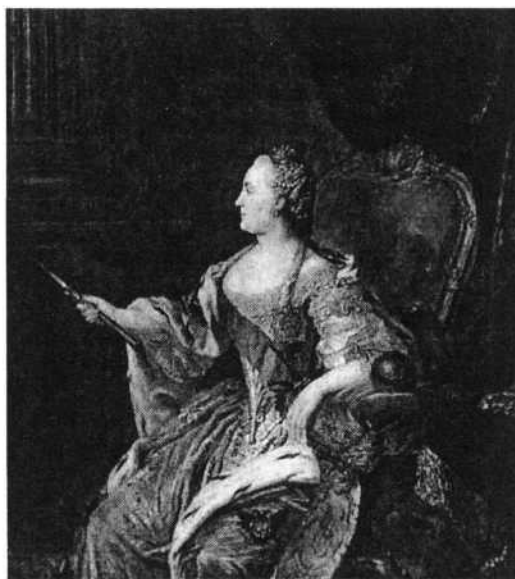
Илл. 3: Ф. Рокотов, Портрет Екатерины II 1763.