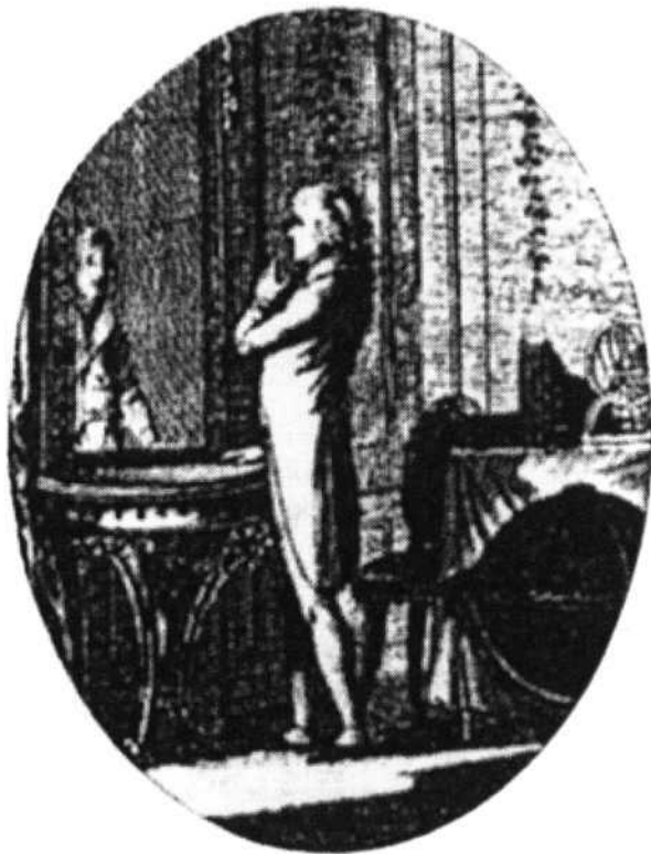
Илл. 1: Иконология, объясненная лицами, или полное собрание аллегорий, эмблем и пр. Т. 2. Москва, 1803

Именно поэтому прошлое рассматривалось через призму именно этой личностной модели. Историческое описание выглядело как семейная хроника, экскурсия по родовому имени с демонстрацией портретов славных предков, портретов хозяев и местом, оставленным для портретов их потомков. Радушный хозяин развлекал своих гостей, а его сын запоминал рассказ, чтобы повторить его у портретов своего отца и деда.